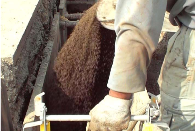
●砂敷設(リブ管のリブ高さ以上を敷く)