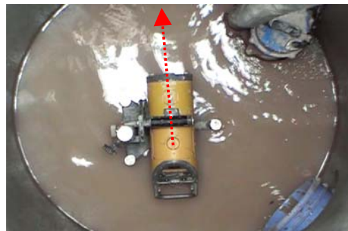
●マンホール内よりパイプレーザーで配管経路を照射