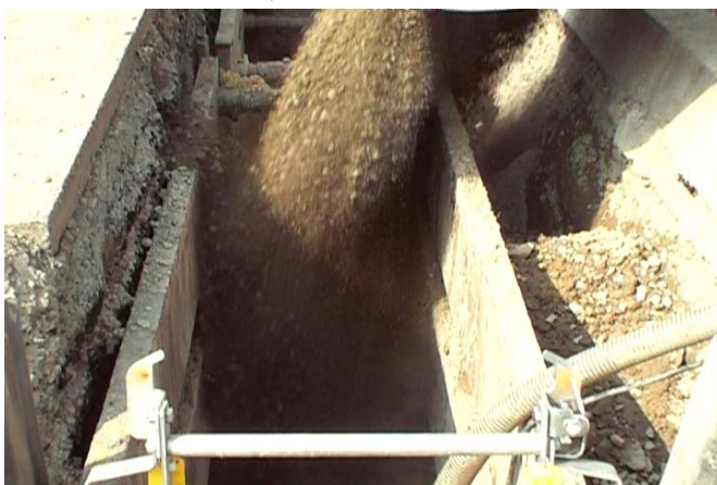
●リサイクル砕石敷設