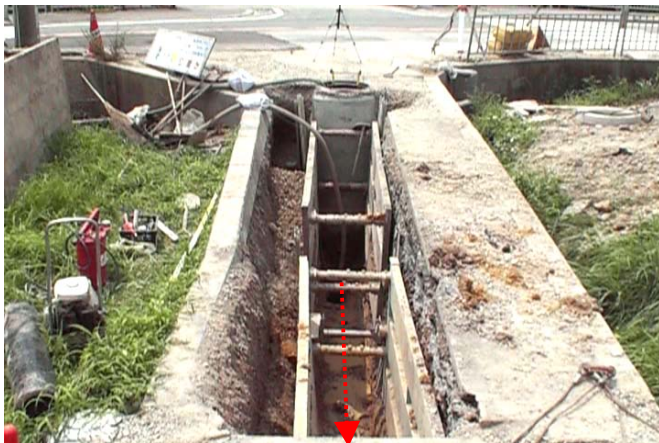
●下水配管施工現場